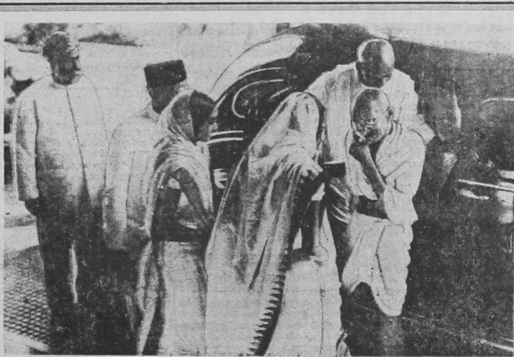
Esta fotografía del patriota indio Mahatma Gandhi, le fué tomada al llegar a Bombay, India, terminado su viaje desde Rajkot, tras de haber llegado a un arreglo con las autoridades inglesas que le permitió dar por terminada su huelga de hambre

HENDAYA, 2 UP. — Informes llegados a la frontera afirman que el general Gonzalo Queipo de Llano ha declinado la alta posición de embajador español ante el gobierno argentino y cualquier otro nombramiento que le obligaría a ausentarse durante un largo periodo del suelo español, donde, según sus declaraciones, todavía "hay mucho trabajo que cumplir". Se entiende que el ex-jefe del ejército nacionalista del sur orgullo al generalísimo Franco que accediera a la demanda de los militares y estableciera una dictadura militar bajo un triunvirato de jefes, entre ellos el mismo general Queipo de Llano. Asimismo se dice que el general Queipo de Llano le hizo al jefe de estado la advertencia de que no podría ser conveniente (PASA a la página TRES)